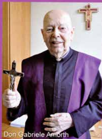
Don Gabriele Amorth

Padre Gabriel Amorth, exorcista de la diócesis de Roma